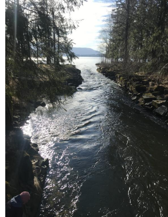
Bilder av Aase Ingesen, Marit Larsen og Silje Bergum