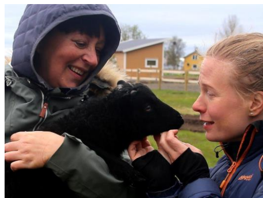
Deltakere fra Hadsel kommune besøkte våren 2019 Vågan kommune og en av Inn på tunet-tilbyderne der for å lære mer om hvordan man kan etablere Inn på tunet som en del av en kommunes tjenestetilbud.