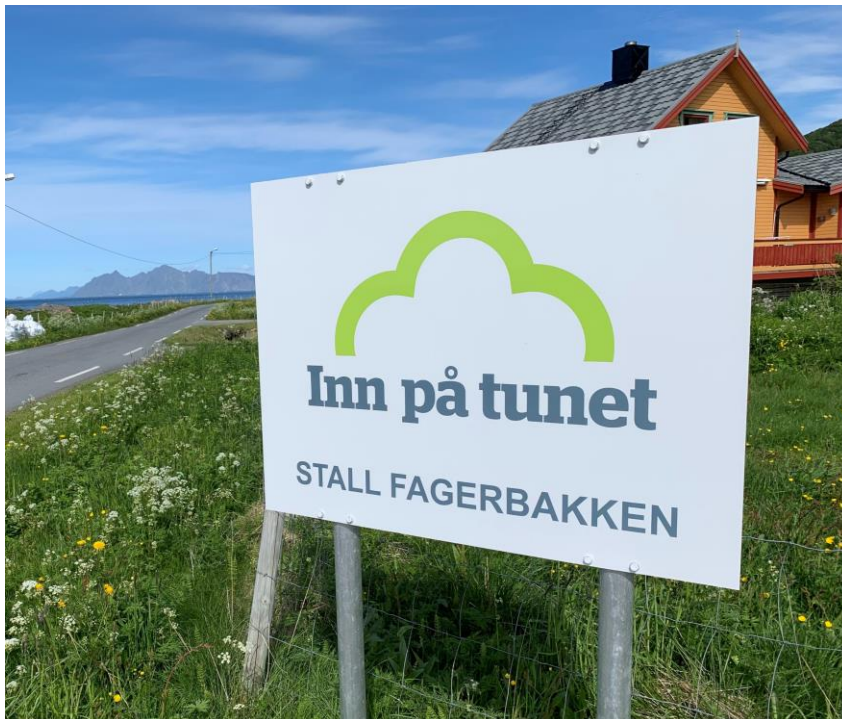
Inn på tunet-merket som vist på skiltet til Stall Fagerbakken i Vågan kommune.

Matmerk er en uavhengig stiftelse som skal bidra til økt mangfold, kvalitet og verdiskaping, og har ansvar for kvalitetssystemet i landbruket (KSL). Godkjenningsordningen for Inn på tunet trådte i kraft 1. januar 2014. Inn på tunet er registrert som et beskyttet fellesmerke og ordmerke. Alle norske gårdsbruk som oppfyller kravene i godkjenningsordningen for IPT har rett til å omtale tilbudet sitt som IPT og bruke merket for IPT. En tilbyder av IPT skal være godkjent av Matmerk. Gjennom KSL har Matmerk ansvaret for godkjenning og oppfølging av IPT-tilbydere. En kontinuerlig kvalitetssikring skjer gjennom revisjoner og tett oppfølging av IPT-tilbyderne.