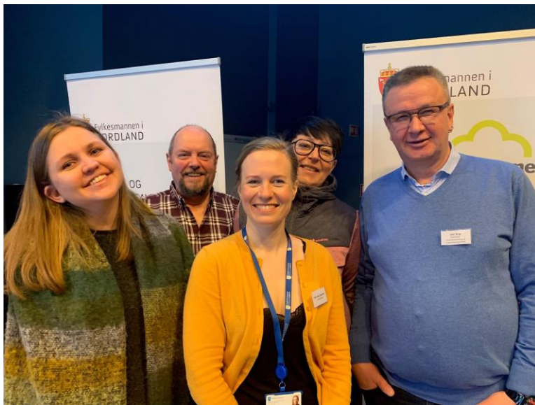
Deltakere fra Hadsel kommune deltok på Fylkesmannens Inspirasjonsseminar for Inn på tunet våren 2019.

Hadsel kommune har et sterkt ønske om å kunne gi ulike brukergrupper i kommunen et Inn på tunet-tilbud. Dette er forankret både politisk og administrativt. Fylkesmannen i Nordland har gjennomført informasjonsmøte i kommunen for en tid tilbake, og flere av de kommuneansatte har deltatt på aktiviteter i regi av Fylkesmannens pågående Inn på tunet-prosjekt, deriblant konferanse, seminar og studietur. Imidlertid har ikke kommunen i dag godkjente tilbydere av Inn på tunet, men landbruksansvarlig sier at det er flere gårdbrukere som kunne tenke seg å gi et slikt tilbud. Vi anser Hadsel kommune som en god kandidat for å delta i pilotprosjektet om Inn på tunet for grunnskolen.