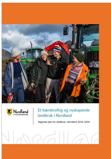
Regionalt næringsprogram for landbruket i Nordland 2019-2022 og Regional plan for landbruk i Nordland 2018-2013