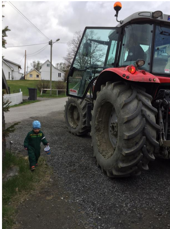
Barn er en av brukergruppene som kan benytte Inn på tunet-tjenester.